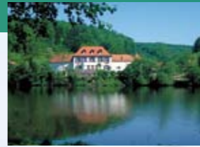
Würzbacher Weiher mit Annahof

16,8 km: Links taucht der Sägeweier auf. Hinter dem Sägeweier, direkt links, über den Weierdamm, dann rechts, Richtung Niederwürzbach weiterfahren.